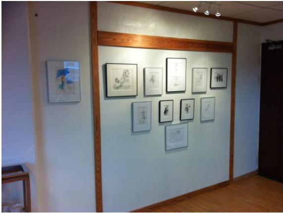
Langvegg de 3, hovedfelt: 2,07 m Del til venstre: 0,5 m