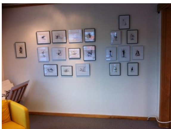
Langvegg del 1: 3,57 m