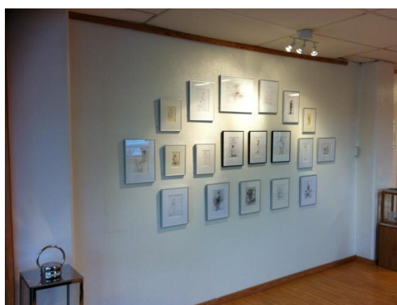
Langvegg del 2: 3,65 m. Monter i høyre hjørne 20x20 cm