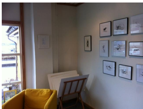
Til høyre for vinduet: To utstillingsfelt: 39 cm og 60 cm. Plakat-krybbe for litografi e.l.