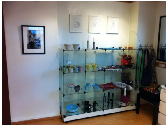
Kortvegg 2: Glassmonter m 8 rom, 41x41 cm Til venstre: 0,87 m Over: 1,70 m