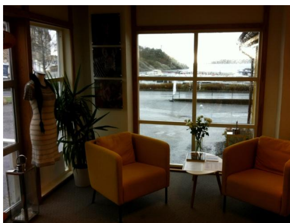
Kortvegg 1 v/inngang: Vindu mot sjøen m/ stoler og bord. Bildene til venstre er en del av presentasjonen av våre reiser.

Totalt areal: 47 m 2 , stor parkeringsplass utenfor, inngang med trapp og rullestolsrampe.